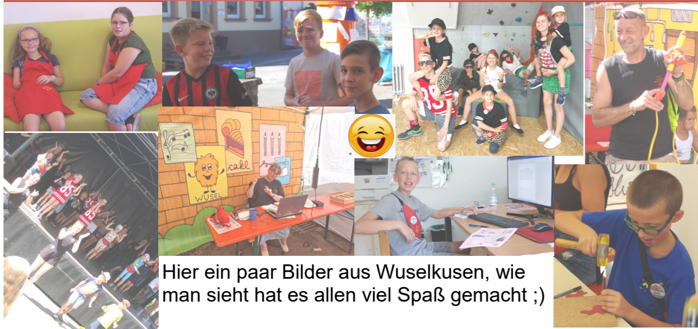
Hier ein paar Bilder aus Wuselkussen, wie man sieht hat es allen viel Spaß gemacht ;)